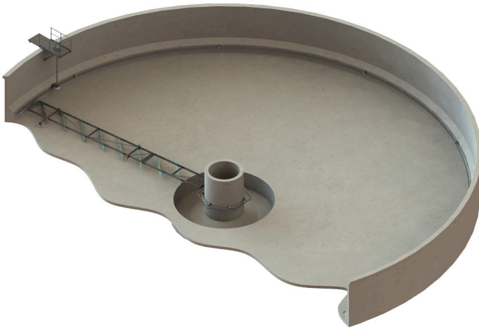
Radialer Bodenräumer ECBS mit trocken aufgestelltem Antriebsaggregat